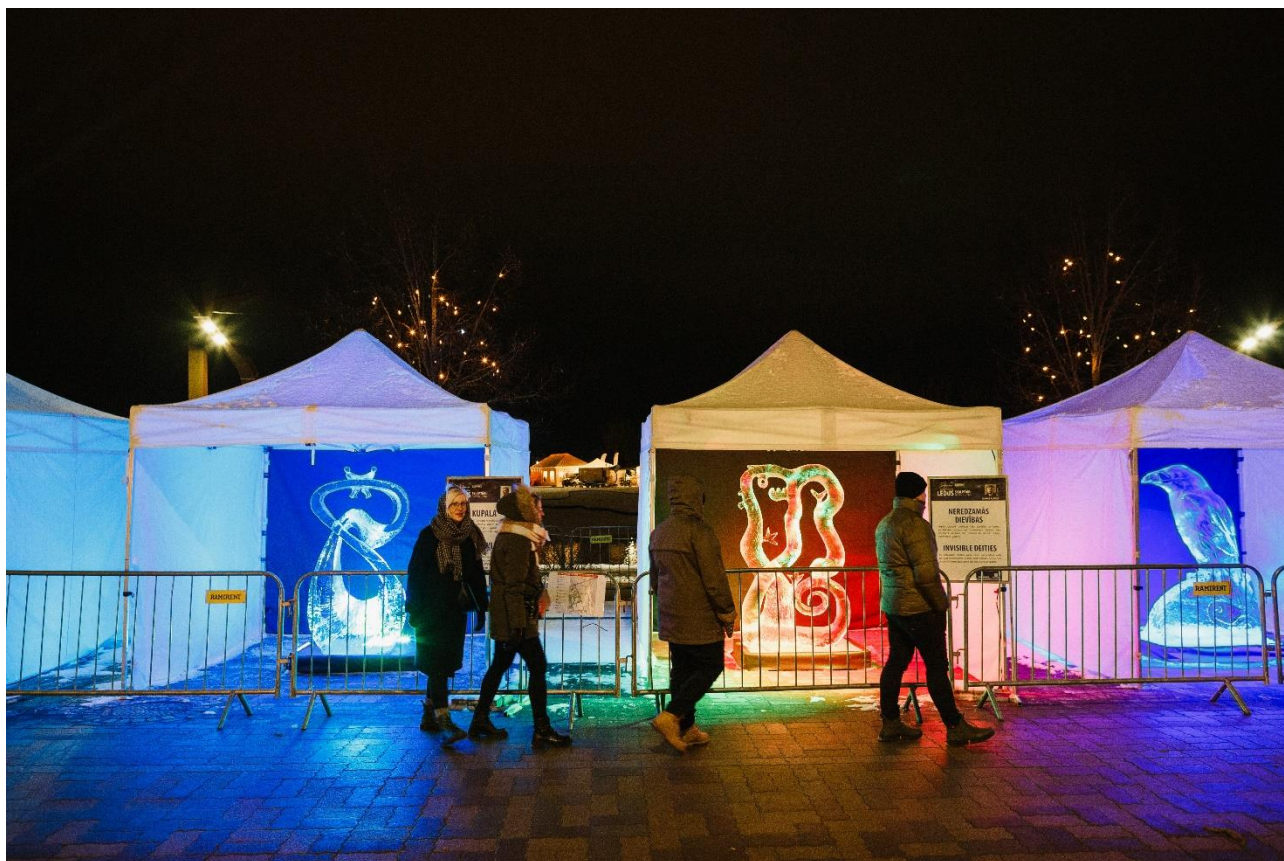
KOMANDU SKULPTŪRAS NOJUME